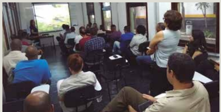
Colaboradores atentos a palestras e atividades na Sipat Rio