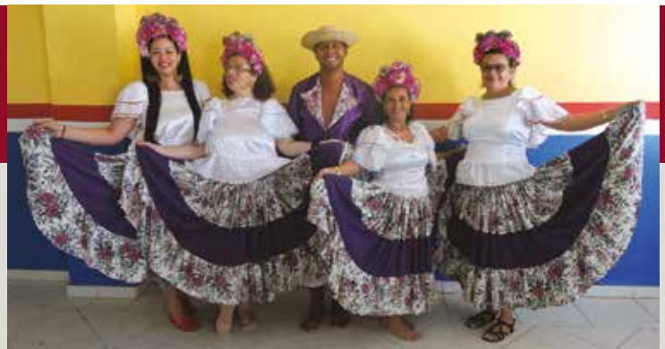
Atividades lúdicas como uma apresentação de Carimbó fizeram parte da programação de Belém

Já no Rio de Janeiro, também fizeram parte da programação treinamentos e orientações sobre segurança laboral, palestras dedicadas ao bem-estar no dia a dia profissional, à prevenção de doenças, uso de drogas, educação financeira, além de atividades paralelas, como aferição de pressão e ginástica laboral.