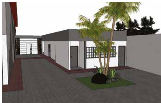
Imagem lateral do projeto do pátio filial Fortaleza

O que acha de ter suas ideias publicadas na próxima edição da Revista Agora ?