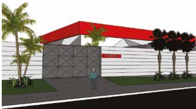
Projeto da nova fachada da filial Fortaleza