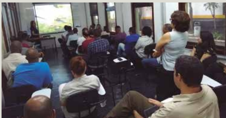
Colaboradores atentos a palestras e atividades na Sipat Rio